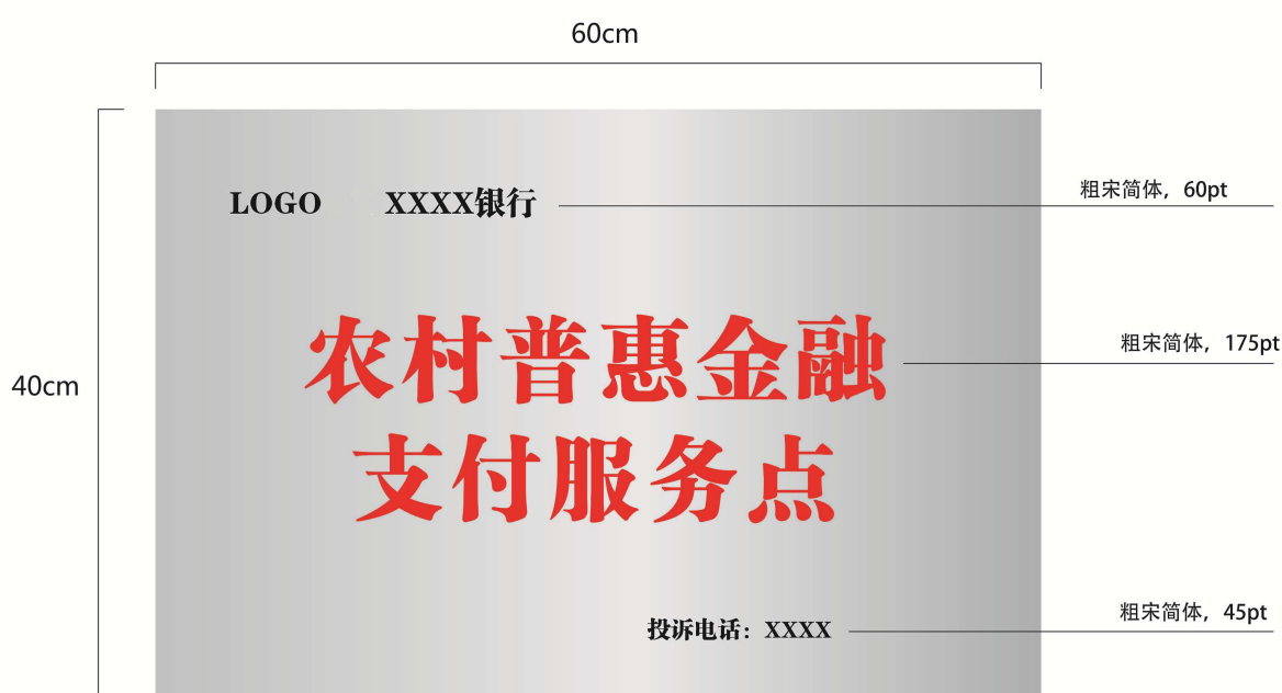
图A.1 农村普惠金融支付服务点标识牌样式

本附录给出了农村普惠金融服务点类型之一的农村普惠金融支付服务点标识牌的样式，如图A.1所示。