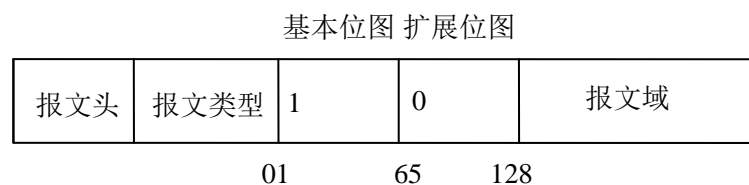
图4 包含基本位图和扩展位图的报文