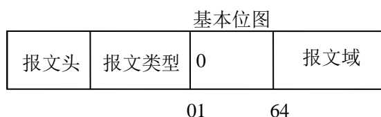
图3 仅包含基本位图的报文