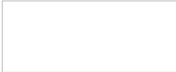
图 A.2 数据流

云服务商应在此处提供一张或多张图(见图 A.2),描述进出系统边界(包括内部边界)的数据流。