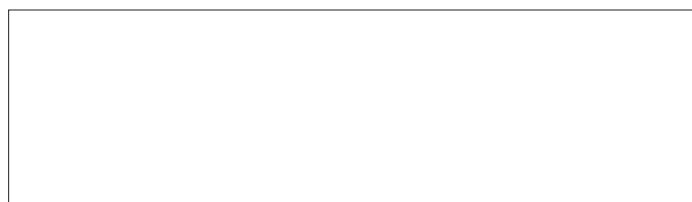
图 A.1 网络拓扑图

云服务商应在此处提供一张或多张网络拓扑图,并在拓扑图 A.1 中清晰描述下列内容:主机名、DNS 服务器、鉴别和访问控制服务器、目录服务器、防火墙、路由器、交换机、数据库服务器、主要应用、互联网接入服务提供商、VLAN 等[若有多图,标为图 A.1(a)、图 A.1(b)···]。